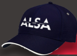
ALSA DAILY CAP