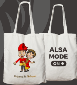
BACOBECCE & ALSA TOTE BAG