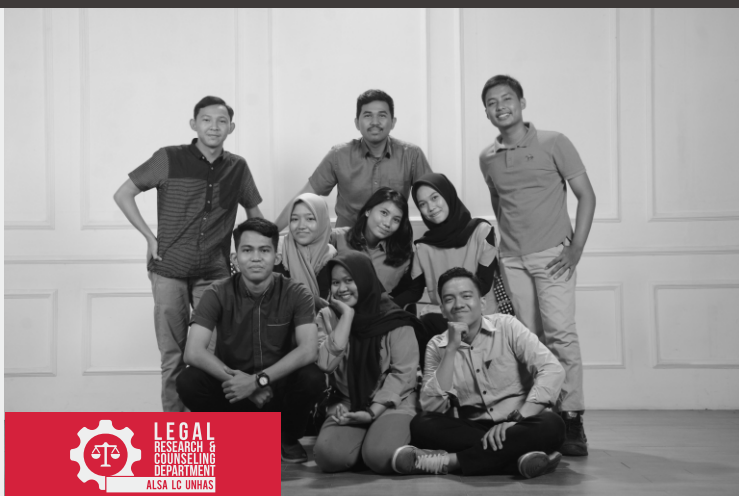
LEGAL RESEARCH & COUNSELING DEPARTMENT ALSA LC UNHAS