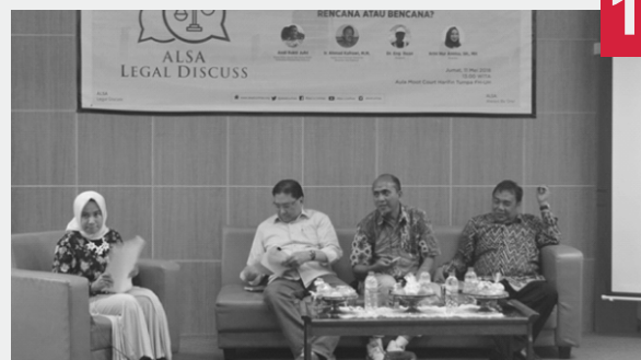
ALSA LEGAL DISCUSS

ALSA Legal Discuss (ALDIS) adalah kegiatan diskusi yang dilaksanakan ALSA LC Unhas yang membahas tema isu-isu yang terjadi di Makassar serta keterkaitan hukum di dalamnya dengan mengundang mahasiswa Fakultas Hukum se-Kota Makassar dan pemateri dari Kepala Dinas Penataan Ruang Dan Kota dan Akademisi . ALDIS dilaksanakan pada tanggal 11 Mei 2018 dengan tema “Implementasi Kebijakan Penataan Ruang Kota Makassar, rencana atau bencana?”.