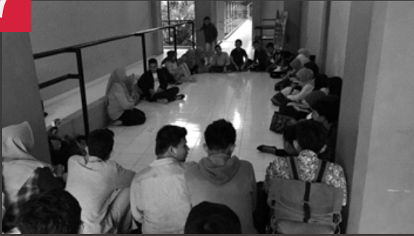
ALSA STUDY CLUB (ASC)

A SC merupakan kegiatan bulanan yang diadakan oleh Legal Research and Counseling Departement (LRCD) dengan tujuan untuk meningkatkan pengetahuan member ALSA LC Unhas terkait isu yang sedang hangat di masyarakat dan melatih member ALSA untuk berfikir kritis dalam menghadapi isu tersebut.