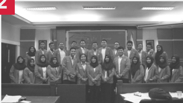
PELANTIKAN DAN UPGRADING

P elantikan dan Upgrading adalah acara tahunan dimana Board of Director yang telah menyelenggarakan fit and proper test untuk calon yang akan mengisi posisi manager dan secretary manager di 10 departemen kemudian manager dan secretary manager dilantik lalu diberikan arahan mengenai administrasi dan keuangan ALSA. Selamat atas dilantikannya Local Board ALSALC Unhas Periode 2017-2018.