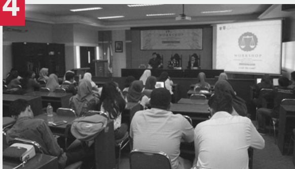
WORKSHOP DAN BEDAH KASPOS NATIONAL MOOTCOURT COMPETITION BULAKSUMUR IV

Workshop dan bedah kaspos national moot court yaitu salah satu agenda kerja ALSA LC Unhas dengan tujuan memperkenalkan National Moot Court kepada member ALSA dan calon delegasi agar nantinya dapat memberikan kontribusi yang maksimal dalam pelaksanaan National Moot Court dengan pemateri Dosen yang ahli dibidangnya.