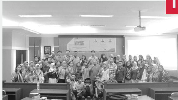
MINING LEGAL WORKSHOP “INTRODUCTION TO INDONESIAN MINING LAW”

M ining Legal Workshop dengan tema “Introduction To Indonesia Mining Law” yang diadakan di Aula Harifin Tumpa dengan tujuan memperkenalkan dan membekali ilmu kepada mahasiswa mengenai hukum pertambangan yang ada Indonesia dengan pemateri yaitu Tim Legal dan General Law Manager PT. Kaltim Prima Coal. Dilaksanakan pada 26 & 27 April 2018 di Aula Harifin Tumpa