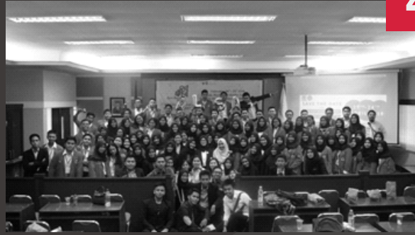
OPEN HOUSE XXIII

O pen Recruitment ALSA LC Unhas terdiri dari 3 tahapan, Open House adalah tahapan pertama yang dilalui oleh calon member ALSA LC Unhas, yang bertujuan untuk mengenalkan ALSA kepada calon member baru. Open House dilaksanakan selama 2 hari, yaitu pada Sabtu, 24 Februari 2018 di Lab. Mootcourt Harifin Tumpa Fakultas Hukum Universitas Hasanuddin dan Minggu, 25 Februari 2018 di Gedung Ipteks Unhas.