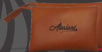
ALSA POUCH BAG