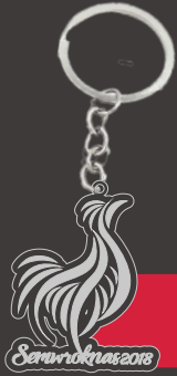
ALSA KEY CHAIN