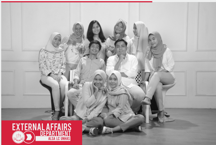
EXTERNAL AFFAIRS DEPARTMENT ALSA LC UNHAS