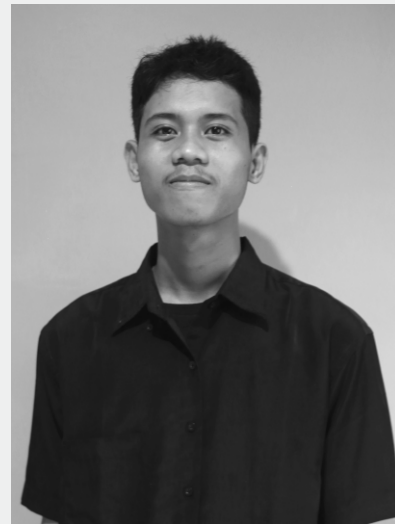
HUZNUL FAIDZIN PROJECT OFFICER PATH VOL. IX