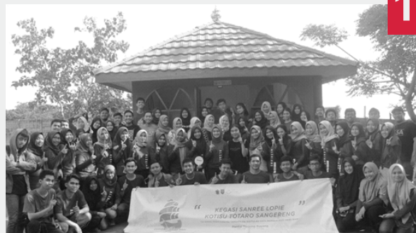
TUDANG SIPULUNG XXIII

T udang Sipulung merupakan kegiatan ramah tamah yang diselenggarakan oleh para member baru yang telah resmi bergabung ALSA LC Unhas dengan tujuan memperkenalkan dan mengakrabkan member baru kepada pengurus, demisioner, dan alumni ALSA LC Unhas. Kegiatan ini berlangsung 28-29 april 2018.