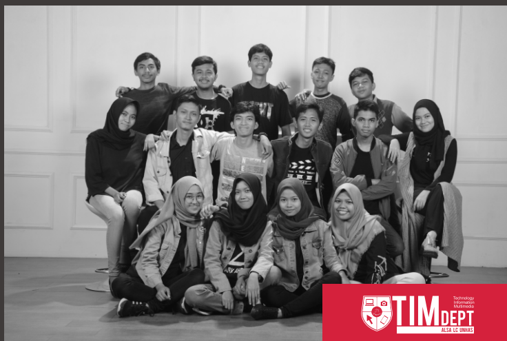
TIM DEPT Technology Informed Management ALSA LC UNHAS