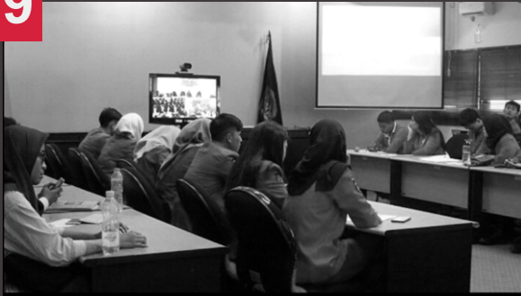
ALSA NATIONAL VIDEO CONFERENCE