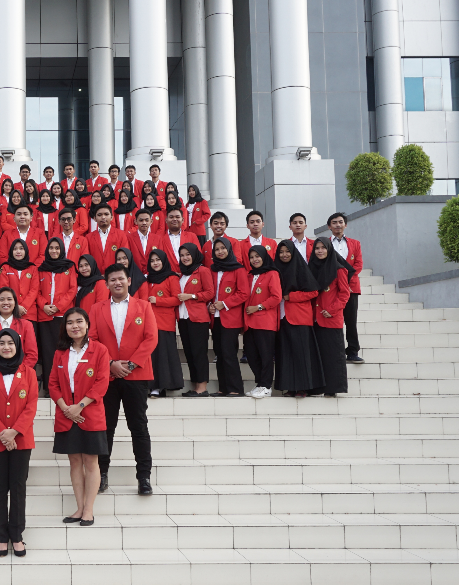
STUDENTS' ASSOCIATION UNIVERSITAS HASANUDDIN 2017-2018