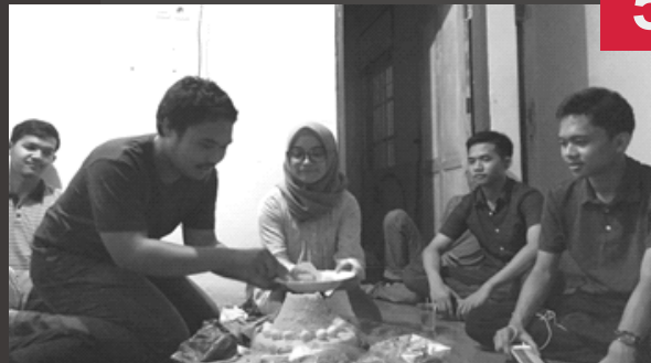
ALSA FUN DAY

A LSA Fun Day merupakan salah satu kegiatan bulanan ALSA LC Unhas yang diselenggarakan oleh Internal Departement dengan tujuan untuk mempererat tali silaturahmi antar anggota ALSA LC Unhas.