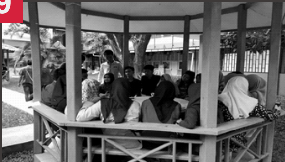
ALSA DEVELOPMENT TALKS

A LSA Development Talks merupakan kegiatan bulanan yang diadakan oleh HRD departement dengan tujuan meningkatkan kemampuan dan pengetahuan member, baik dalam keorganisasian maupun kompetensi lainnya.